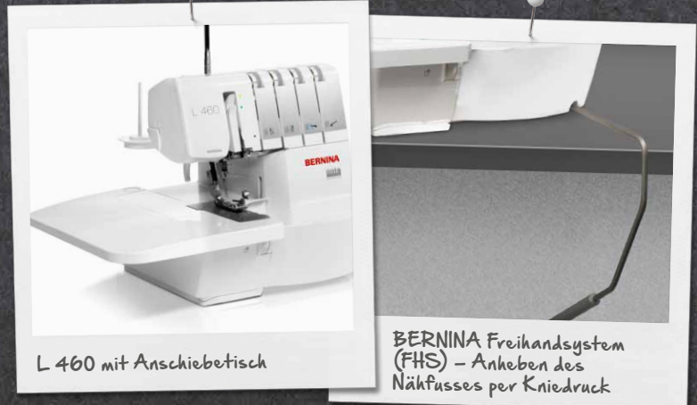
L 460 mit Anschlagbetisch

Der gut ausgeleuchtete, grosse Arbeitsbereich dieser Overlocker erleichtert das Nähen und Einfädeln von Greifer und Nadeln. Dank des Freihandsystems (FHS), über welches der Nähfuss angehoben und gesenkt werden kann, bleiben beide Hände frei für das Nähen und Führen des Stoffs. Der Anschlagbetisch erweitert den Arbeitsbereich und erleichtert das Umsetzen grosser Nähprojekte.