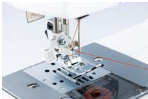
Einfaches automatisches Einfädeln