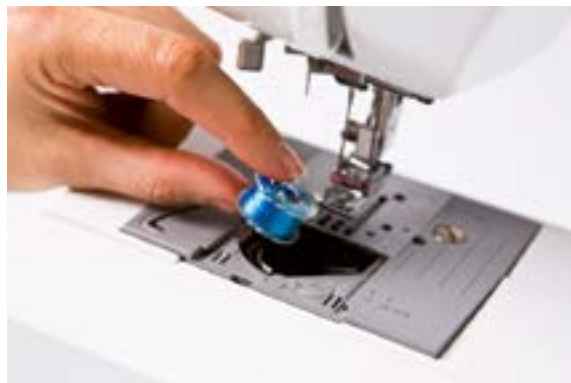
Einfach eine volle Spule einsetzen, schon sind Sie startbereit