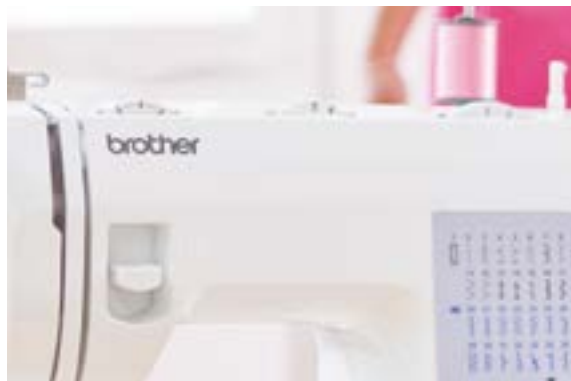
Stichlänge + Stichbreite einstellbar