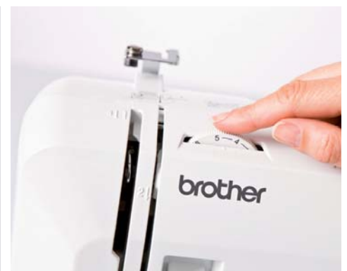
Einfaches Einstellen der Fadenspannung

Weitere Informationen erhalten Sie bei Ihrem Fachhändler oder unter www.brothersewing.eu .