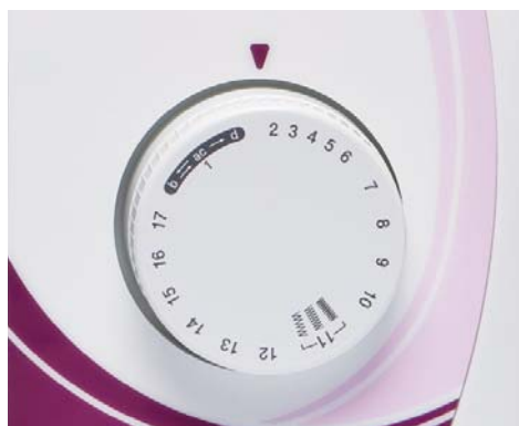
Einfache Stichausswahl mit Wahlknopf